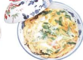
土佐ジロー親子井