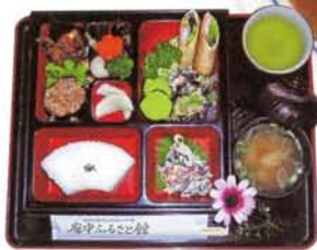
なすづくし弁当 ●要予約・3名様～