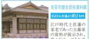
安芸市歴史民俗資料館

昭和57年10月に開館した全国初の公立書道専門美術館。安芸市は藩政時代より書道が盛んで、現在も日本書壇の第一線の書家を多く輩出。館内には、安芸市をはじめ全国の書家の作品を常設展示、また、書道に関する資料も充実しています。