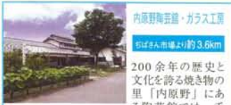
内原野陶芸館・ガラス工房

江戸時代土佐藩の家老であった五藤家の資料が展示され、代々伝わってきた武器・甲冑をはじめとして、美術工芸品、古文書などの貴重な品々が安芸の歴史を物語っています。郷土出身の岩崎弥太郎、黒岩派春、富田幸次郎、弘田龍太郎などの資料や遺品も展示されています。